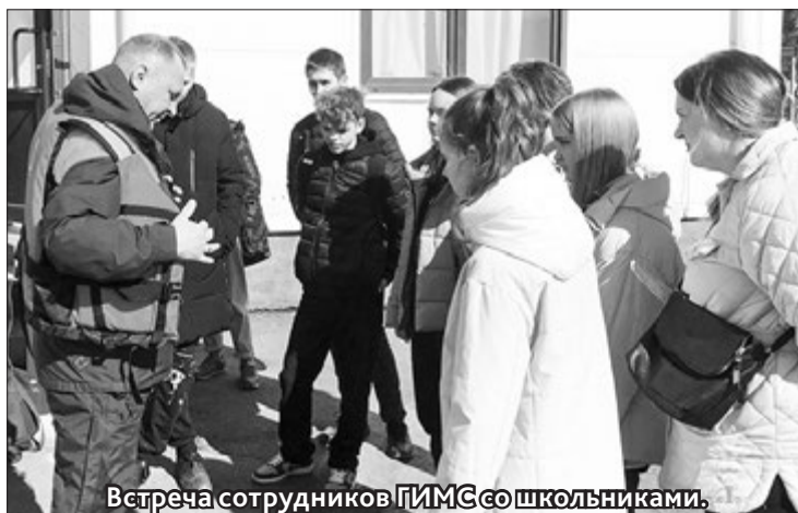
Встреча сотрудников ГИМС со школьниками.

В РАМКАХ подготовки к проведению военно-патриотической игры «Виват, Победа» спасателями Сортавальского ПСО совместно с инспекторами инспекторского отделения ГИМС проведено показательное мероприятие. Сотрудники ГИМС рассказали правила безопасного поведения на водоёмах в весенний период, о правилах катания на судах, пользования спасательными средствами. Говорили об опасностях, подстерегающих на воде, первой помощи пострадавшему. Спасатели Сортавальского ПСО продемонстрировали технику и специальное оборудование для проведения поиска и спасения людей.