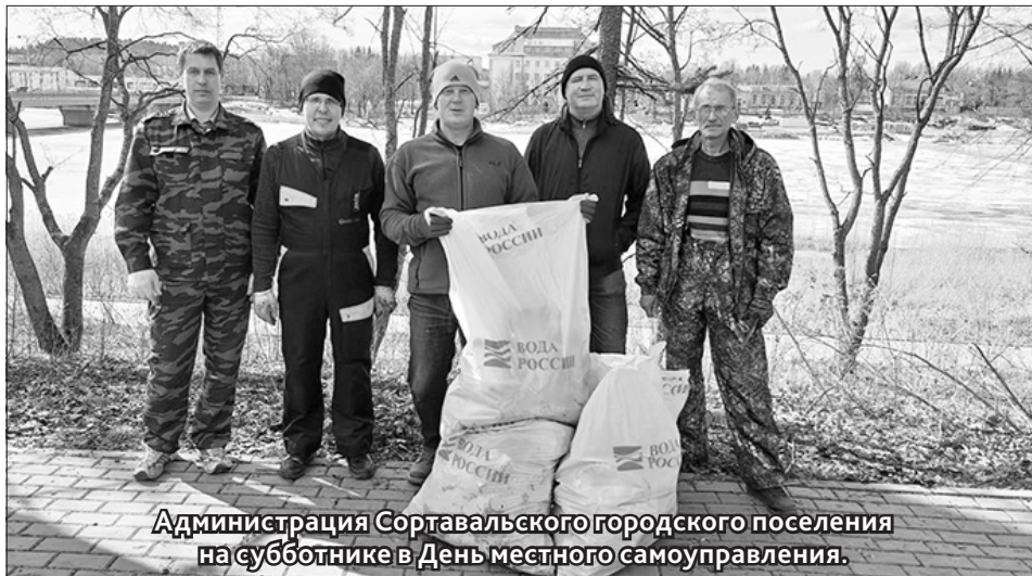
Администрация Сортавальского городского поселения на субботнике в День местного самоуправления.

В СВЯЗИ с потеплением на Ладожском озере и внутренних водоёмах начинается естественное разрушение ледяного покрова. Инспекторское от-