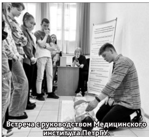
Встреча с руководством Медицинского института ПетрГУ.

В ИНФОРМАЦИОННО-МЕТОДИЧЕСКОМ центре состоялась встреча с руководством Медицинского института ПетрГУ. Детей познакомили с историей Медицинского института, основными направлениями подготовки, с проектом «Волонтеры – медики». Студенты Медицинского института показали мастер-класс «Основы первой помощи – сердечно-легочной реанимации». Слушатели смогли сами попрактиковаться в оказании первой помощи на тренажёрах.