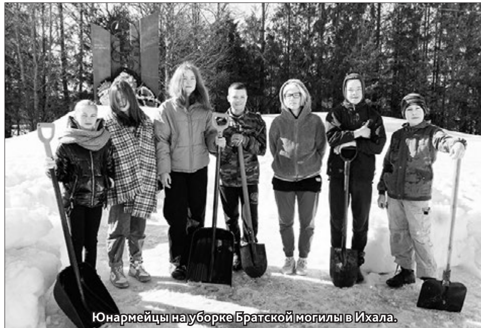
Юнармейцы на уборке Братской могилы в Ихала.

В ГБУ СО РК «Центр помощи детям №7» состоялся плановый выезд мобильной бригады в посёлки Мийнальско-го сельского поселения. Провели мониторинг условий жизни несовершеннолетних, проживающих в замещающих