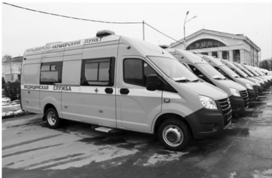
Мобильные ФАПы.

До конца месяца передвижные медкомплексы придут в четыре поселка и деревни