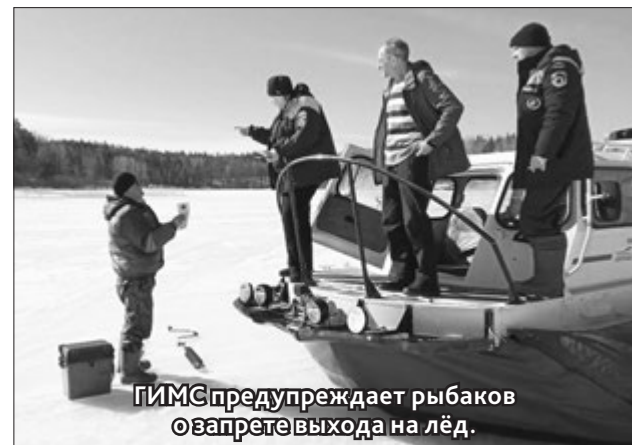
ГИМС предупреждает рыбаков о запрете выхода на лёд.

В ЭТОМ году будут подготовлены все проектно-сметные документации на восемь образовательных учреждений района для их дальнейшего капитального ремонта. В Вяртсильской СОШ проектно-сметная документация разработана в 2022 году, ожидаем решение республики на организацию