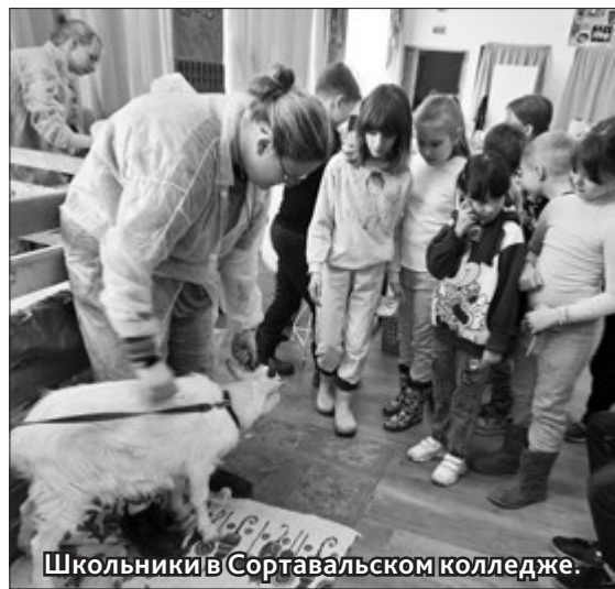
Школьники в Сортавальском колледже.

В РАМКАХ проведения Чемпионата по профессиональному мастерству в Сортавальском колледже прошли профориентационные мероприятия. Обучающиеся школ города Сортавала посетили конкурсные площадки по компетенциям «Ветеринария», «Туризм», «Сельскохозяйственные биотехнологии», «Эксплуатация сельскохозяйственных машин». Школьники познакомились с правилами проведения данных соревнований, увидели работу конкурсантов, посетили учебные лаборатории и площадки, где студенты колледжа обучаются профессиям.