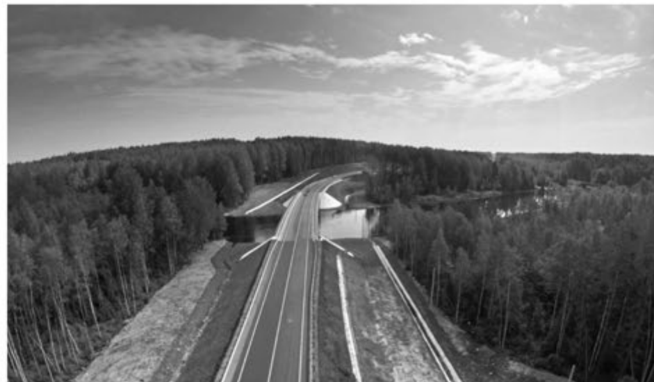
Ремонт дорог в Карелии.