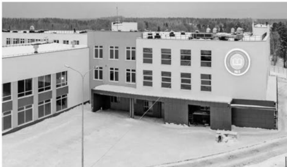
Школа в Деревянке.

В завершение выступления Артур Парфенчиков отметил: то, что сделано за последние несколько лет, обеспечило Карелию возможность справиться с новыми вызовами.