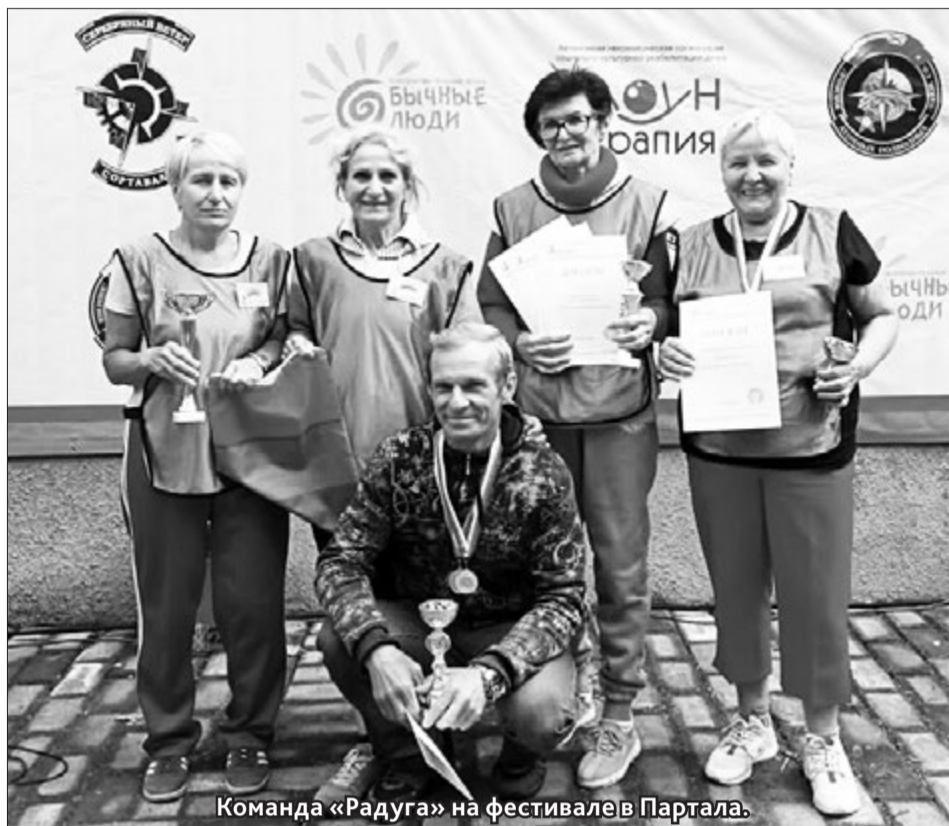
Команда «Радуга» на фестивале в Партала.