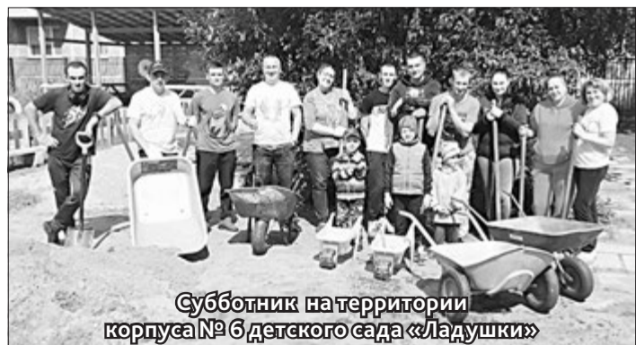
Субботник на территории корпуса № 6 детского сада «Ладушки».

Подготовил Роман Белый.