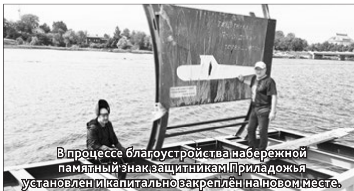
В процессе благоустройства набережной памятный знак защитникам Приладожья установлен и капитально закреплён на новом месте.