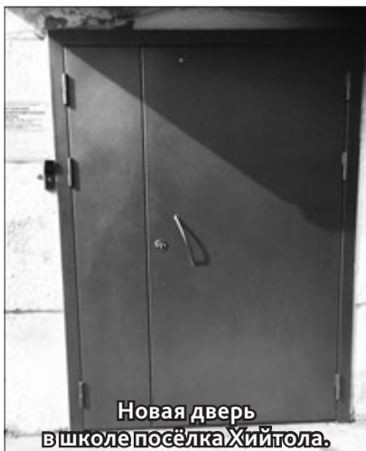
Новая дверь в школе посёлка Хийтола.

В ШКОЛЕ посёлка Хийтола начался монтаж системы контроля доступа в здание. Установлены две новые входные двери, которые оборудуются электромагнитным замком и доводчиками. Аудио- и видеосвязь