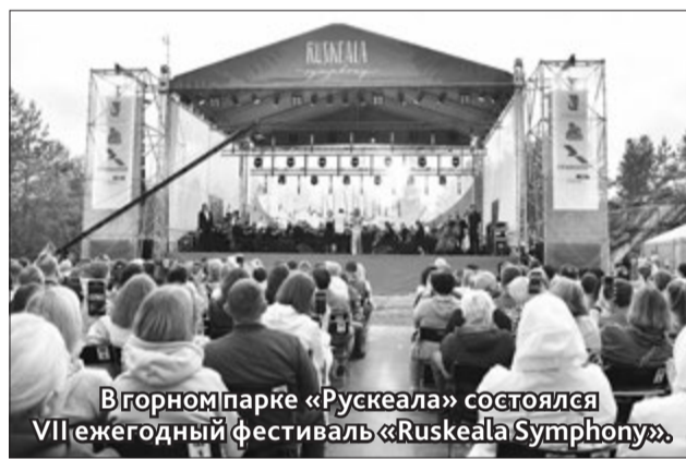
В Горном парке «Рускеала» состоялся VII ежегодный фестиваль «Ruskeala Symphony».